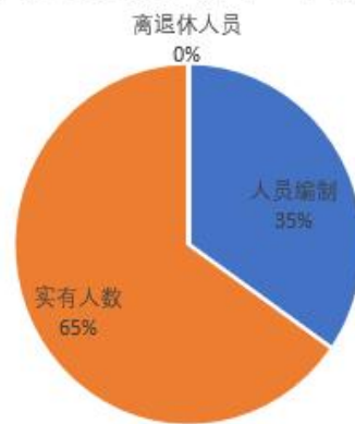
人员结构图（单位：人）

人、事业编制 42 人；实有人员 79 人，其中行政 0 人、事业 42 人。单位管理的离退休人员 0 人。