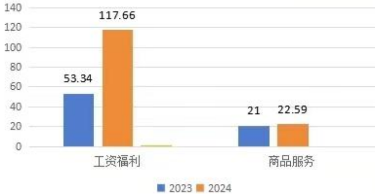
部门预算经济分类支出图 单位：万元